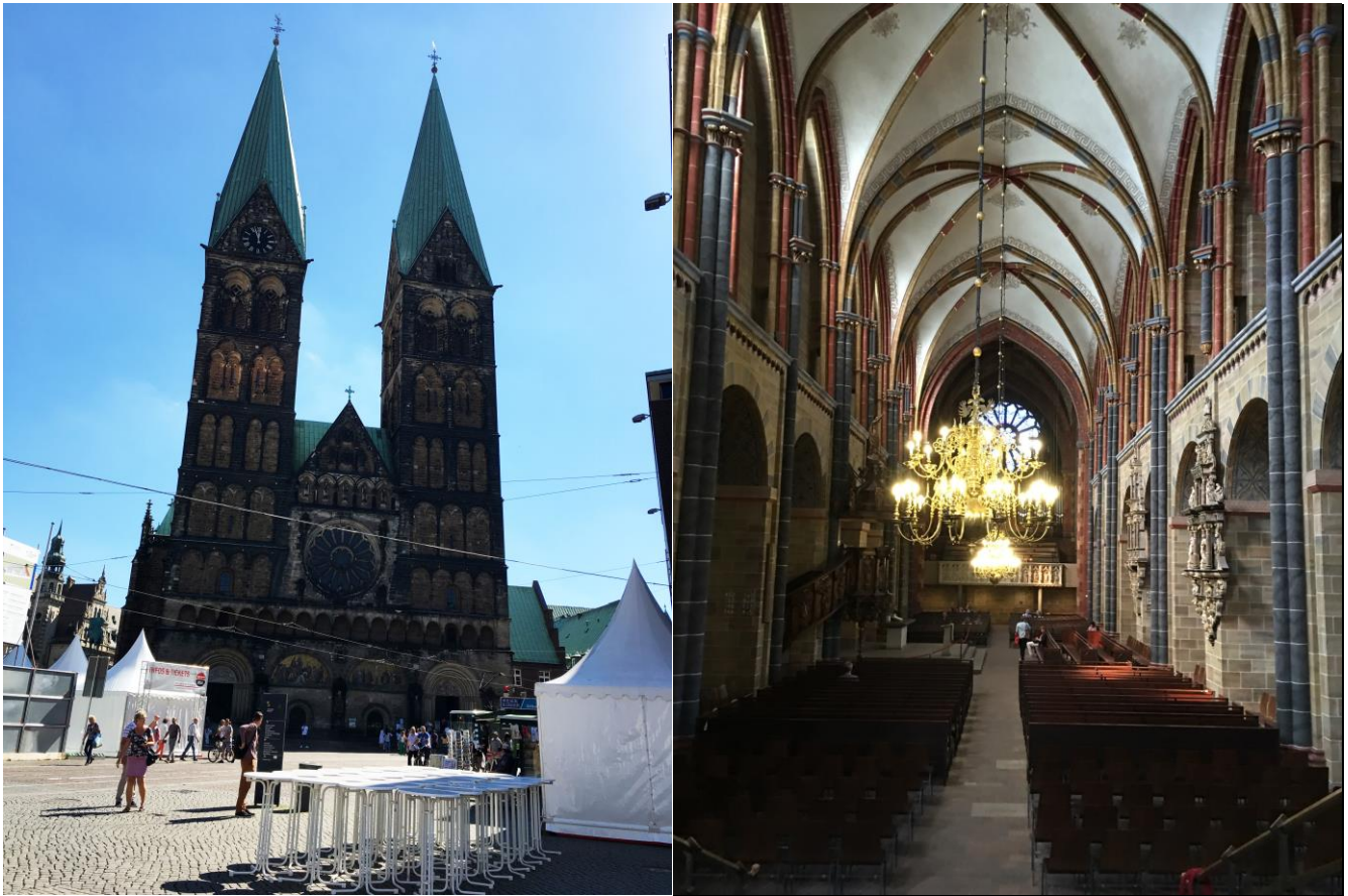
Catedral Luterana de Bremen, uno de los más bellos e imponentes edificios de la ciudad.

El 19, se efectuó un tour a la ciudad de Bremen, especialmente a la fábrica de cerveza Beck, donde los ajedrecistas por correspondencia y los acompañantes, pudieron degustar diversos tipos de cerveza.