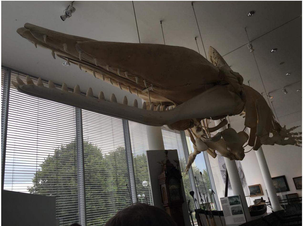
Otros aspectos del Museo Marino.