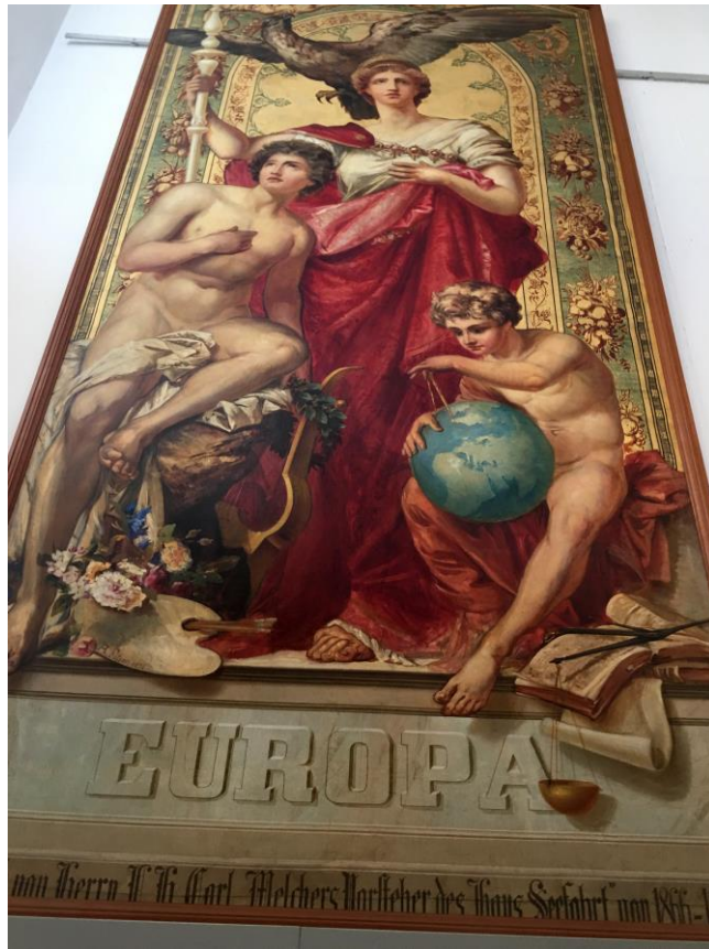
Épicos cuadros de los cinco continentes del pintor, escritor y músico alemán Arthur Fitger.