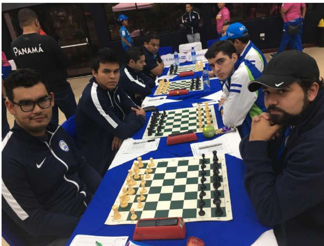
Nuestra escuadra (derecha), vista desde el cuarto tablero, frente a la salvadoreña.