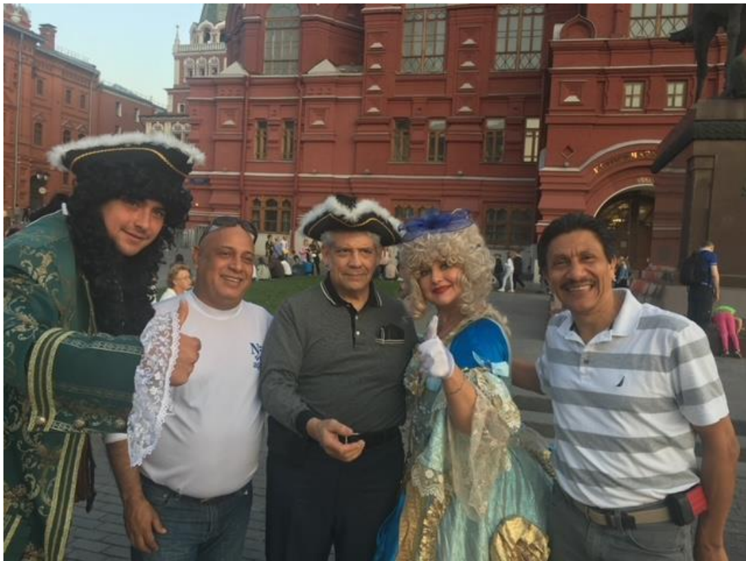
Los tres amigos con esta simpática pareja de moscovitas