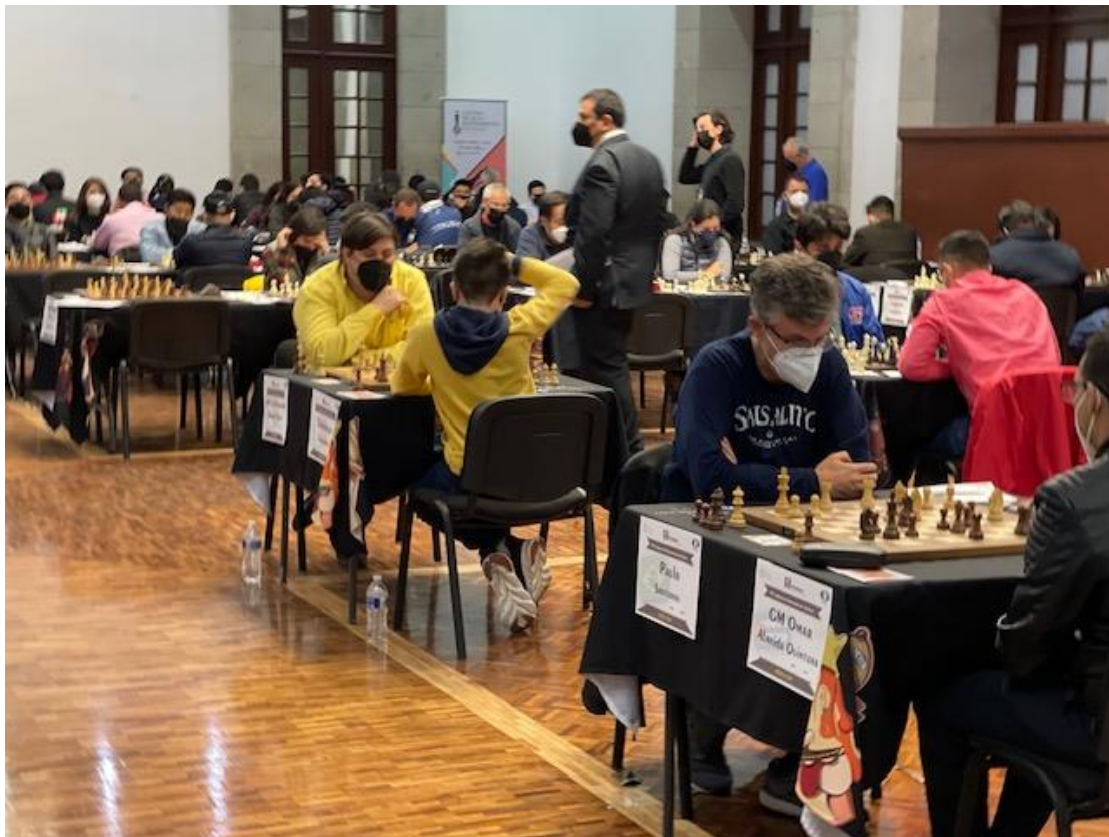
Vista parcial del Campeonato Iberoamericano 2022