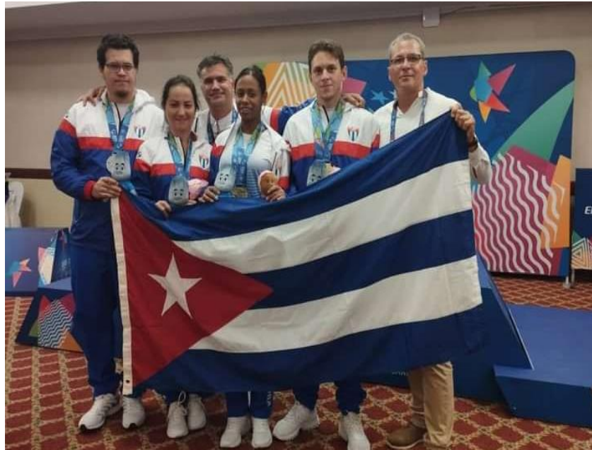
Los campeones cubanos